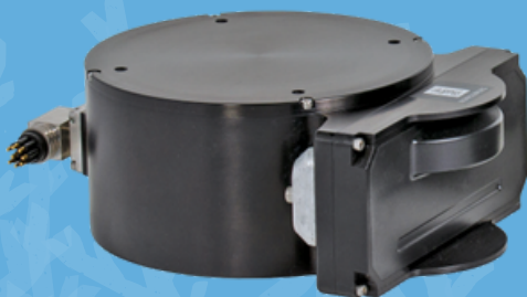
Flexview HF イメージングソナー

Kongsberg社のFlexview HF イメージングソナーを用いて海底から溢れる気泡を再現しリアルタイムで監視する実演デモを実施します。